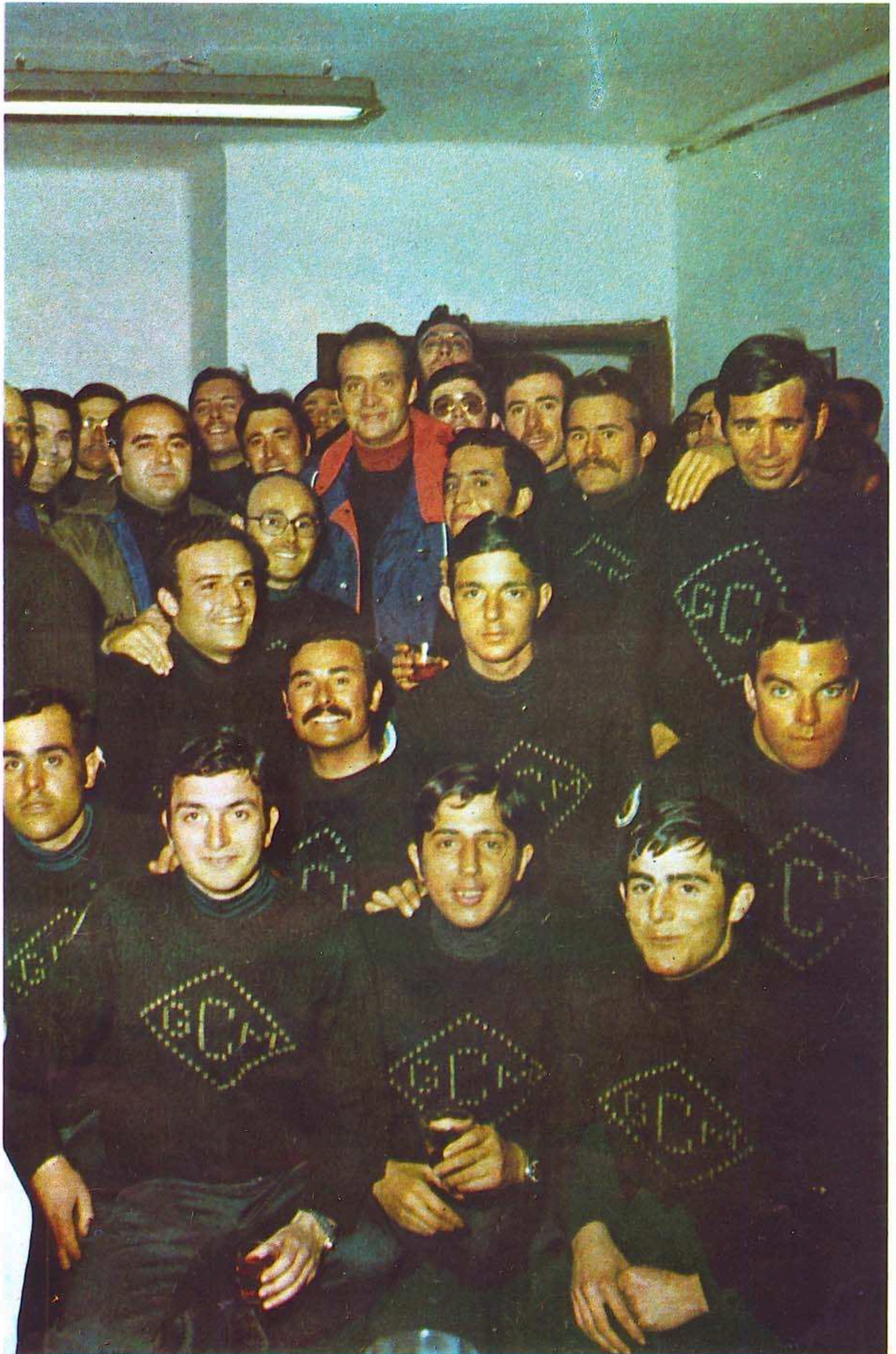
El Rey entre los guardias civiles