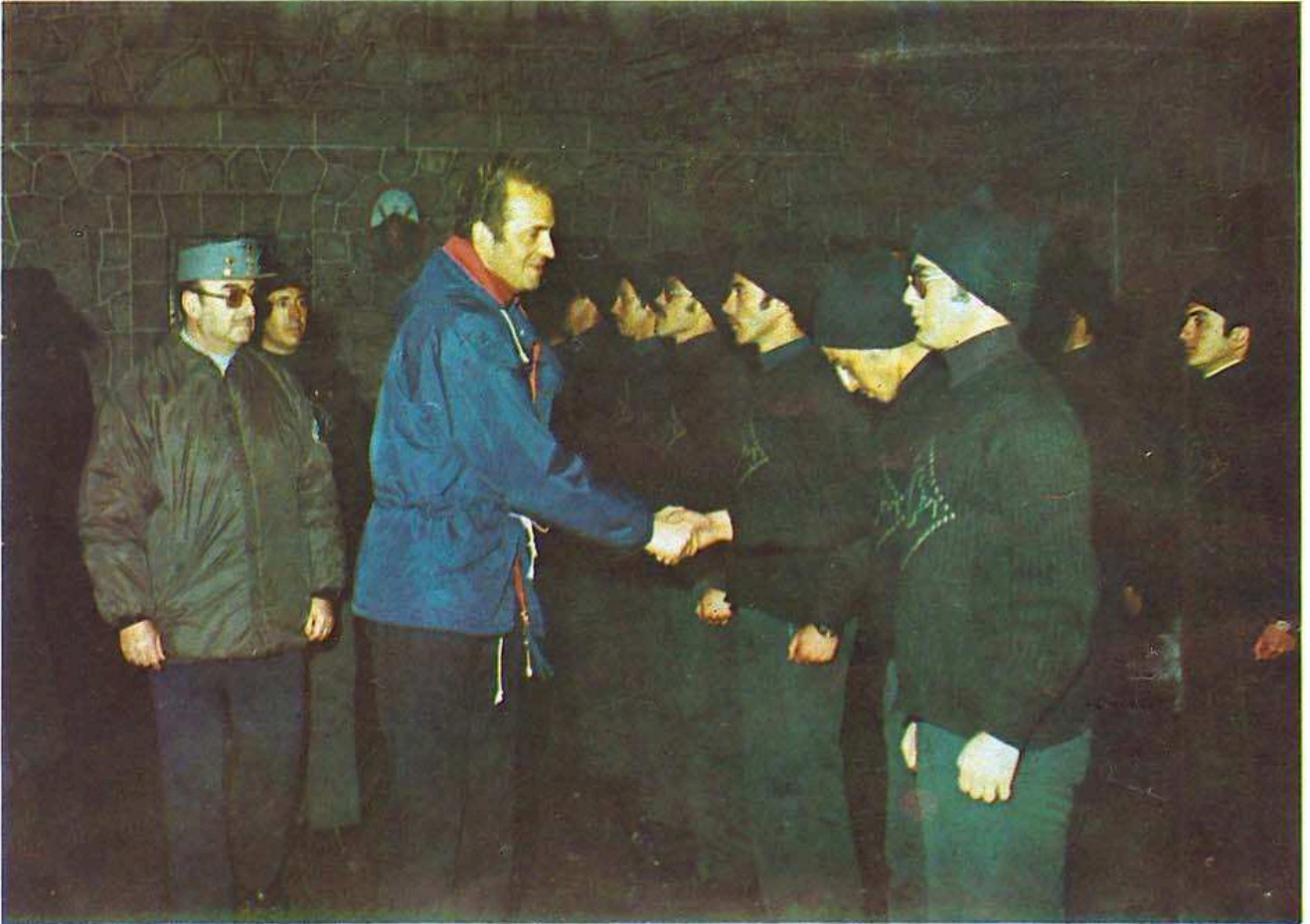
El Rey saludando a los alumnos