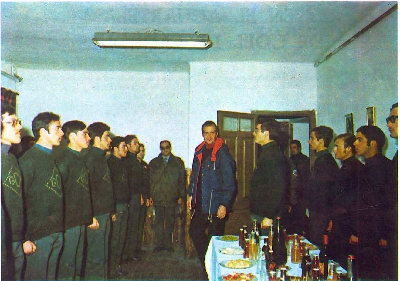
Llegada a la sala donde se sirvió la copa de vino español