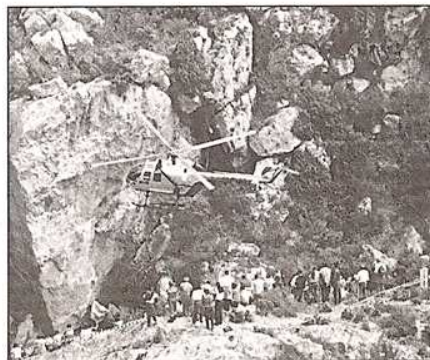
Los especialistas de la Guardia Civil efectuando el rescate de un herido en camilla, y otro utilizando el helicóptero

recordó que «en Huesca cuando se mira al norte se piensa siempre en la montaña» y abogó por la necesidad de mantener la tradición cultural y etnológica de los Pirineos pese a las avalanchas turísticas que se producen. En su discurso oficial, también señaló que el turismo tiene que ser en el Pirineo oscense una segunda actividad económica «porque sino podemos incluso llegar a perder la montaña».