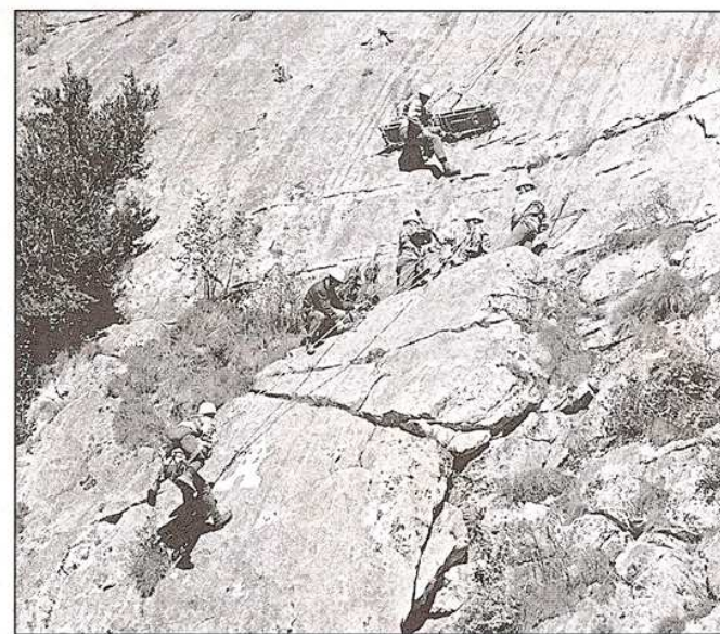
La situación de emergencia que se crea en las montañas es algo evidente, tal y como se puede contemplar a través de las presentes imágenes