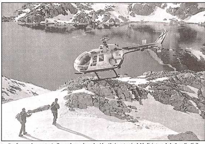
Dos formas de rescate: Arriba, en busca de un herido. Abajo, a través del helicóptero de la Guardia Civil