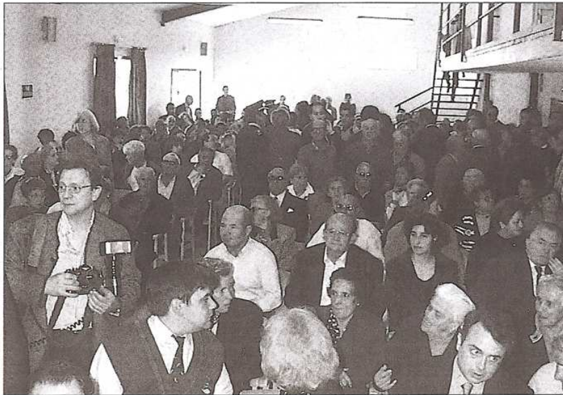
Los vecinos de La Adrada están llamados a participar de las ferias que arrancan estos días

De manera simultánea a la Feria de los Santos, se celebrará una nueva edición de la recién creada Feria de Muestras de La Adrada, que vivirá en esta ocasión su tercera edición y contará con algunos cambios respecto a las dos anteriores, según señala sobre el particular Javier Ca-