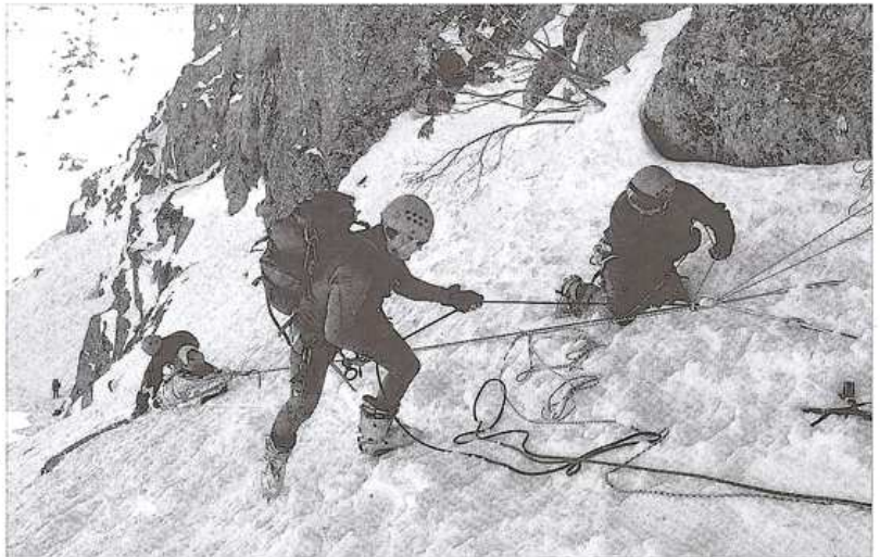
Práctica de un rescate, durante los cursos de formación que se realizan en Candanchú.