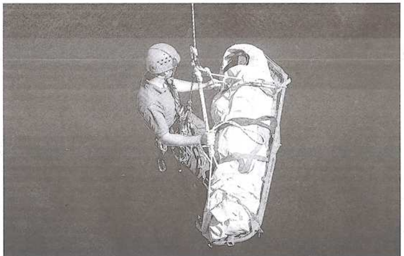
Los miembros del Ereim utilizan habitualmente la tiorolina en los rescates.