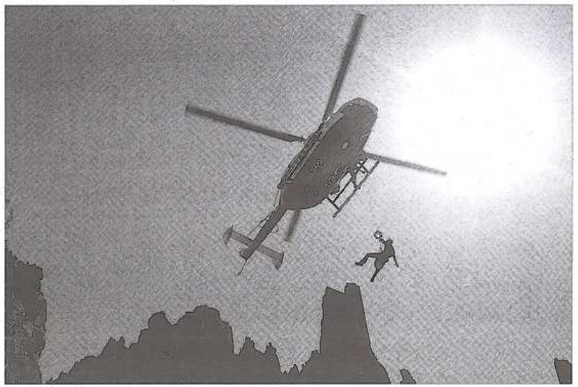
Uno de los rescates realizados por el Ereim en helicóptero, en Galayos. / F.R.D.