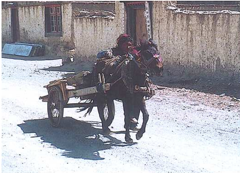
Carro en una aldea tibetana

El 21 de abril partimos vía París e Islamabad (Pakistán) hacia la bonita localidad de Kathmandú en Nepal. El primer escollo que debimos salvar fue