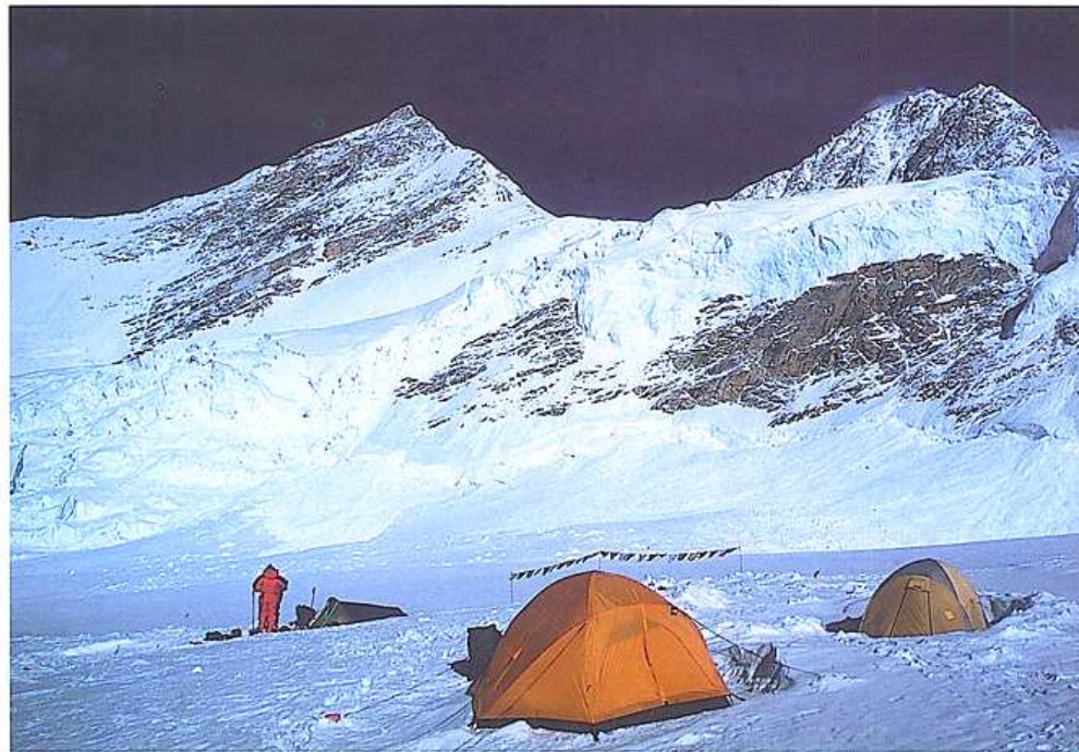
Izquierda, El Shisha Pangma el campamento base avanzado. Parte superior, yaks cargado con el material. El campamento 1 a 6.400 metros.