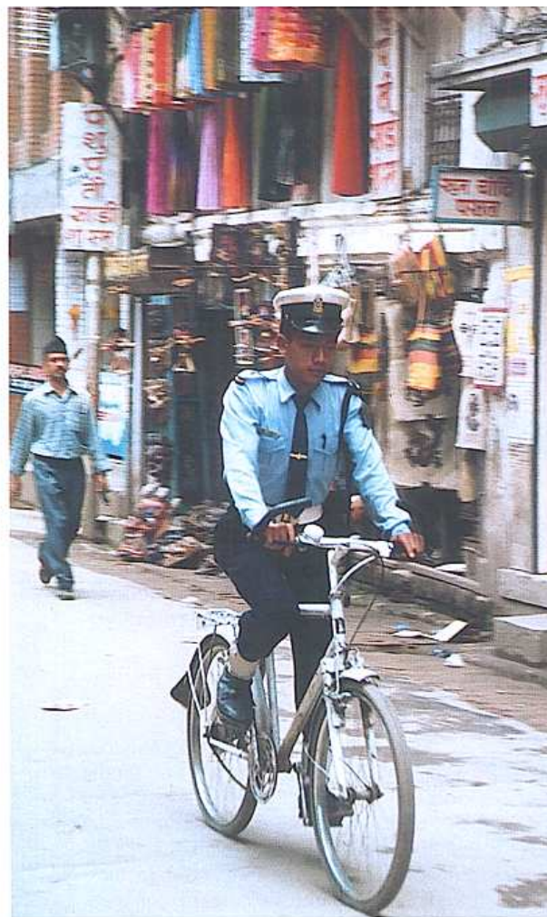
Policía en Kathmandu