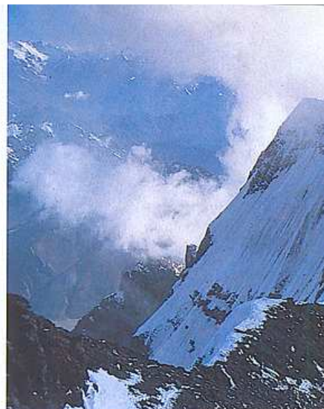
El Aconcagua (de izq. a dcha.): cara oeste desde la Plaza de Mulas; la cumbre sur desde la principal; campamento en Piedra Grande; la sombra del Aconcagua proyectada en la capa de condensación del horizonte al amanecer; los tres expedicionarios y la cumbre a las 17:52 del 27 de enero.

mos hasta el collado de Portezuelo del Manso (5.200 m), al objeto de establecer allí el Campamento I Nido de Cóndores , donde dejamos un depósito de comida y material. Como no estamos aún bien aclimatados, la ascensión se hace dura y al bajar decidimos descansar un día en el campamento base. El día 23, con algunas nubes en el cielo, comenzamos la ascensión al Campamento I con idea de pernoctar allí, pero conforme vamos subiendo, las nubes tomaban forma más compacta y un fuerte viento no nos deja ni montar la tienda en Nido de Cóndores . Mientras subíamos, nos cruzamos con un grupo de montañeros vascos que había hecho cumbre el día anterior, plantándole cara al fuerte viento. Al empeorar el tiempo preferimos pasar una noche tranquila en Plaza de Mulas a pasarla mal en el Campamento I y bajamos. La idea fue acertada, pues el día 24 continuó el mal tiempo y el viento blanco del Aconcagua hizo bajar a más de uno pensando en que se avecinaba un temporal de nieve como el de la semana anterior.