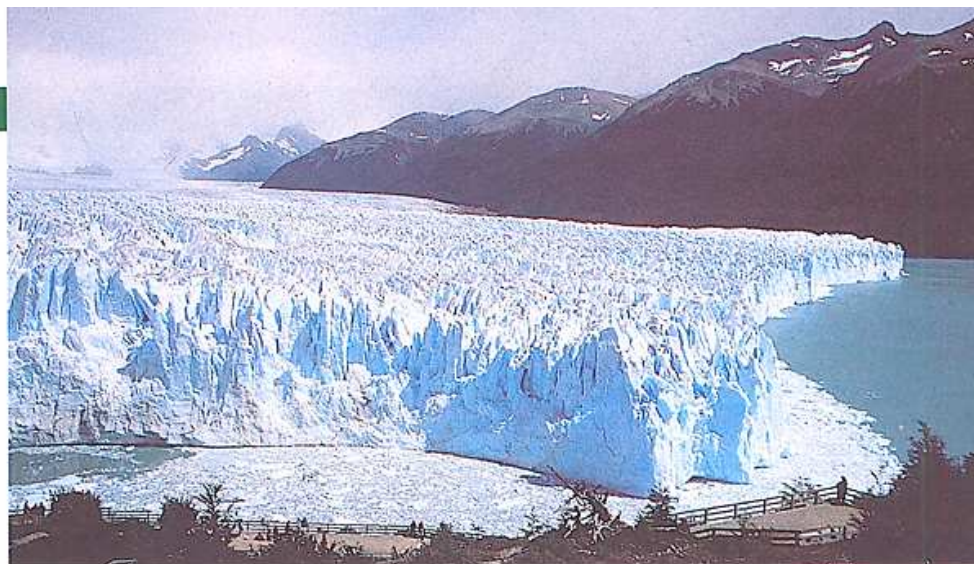
Vista del glaciar Perito Moreno desde la península de Magallanes.

Al día siguiente visitó el Glaciar Perito Moreno, uno de los pocos glaciares en crecimiento que quedan en el mundo y que cada cuatro años aproximadamente se cierra sobre la península de