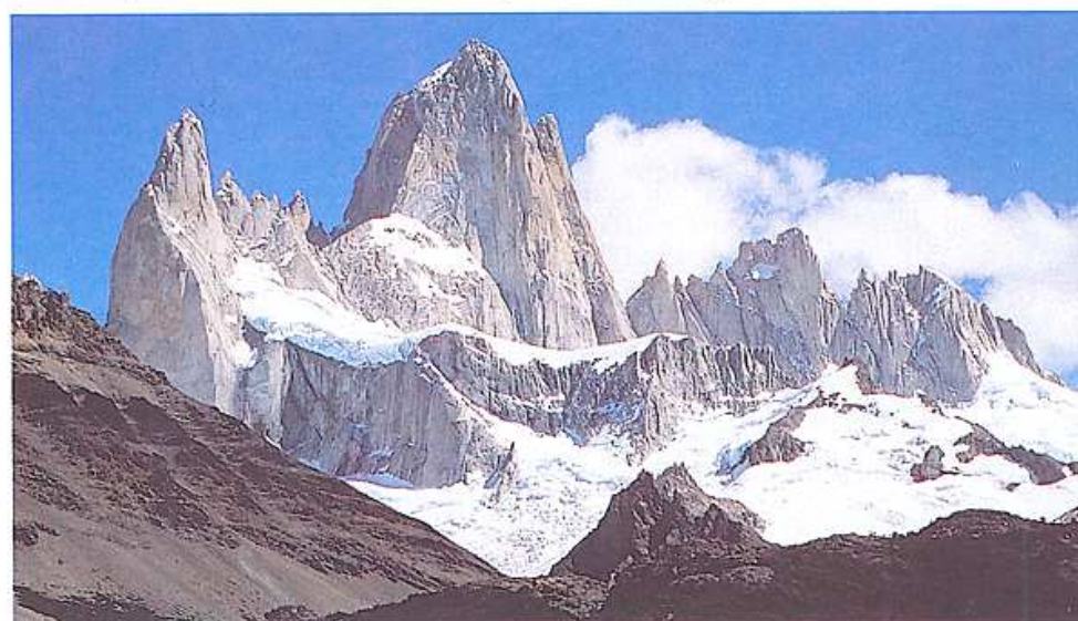
El Fitz Roy, una de las impresionantes montañas de la Patagonia argentina.

Magallanes, dividiendo en dos al lago Argentino e inundándose una de dichas partes, al no tener por donde desaguar y rompiendo el glaciar por la presión de las aguas. Durante la visita se ven grandes seracs desprendiéndose del glaciar y precipitándose en el agua del lago.