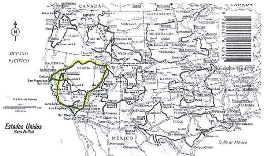
Recorrido desde la ciudad de San Francisco hasta la misma

La belleza de este Parque Nacional es extraordinaria y la altura y dificultad de