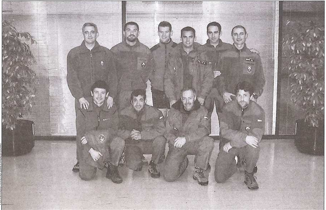
Integrantes de la expedición de la Guardia Civil al Cho-Oyu.

Alrededor de 1000 kilogramos de carga se llevan a esta aventura, de los que 700 han sido embalados en bidones de plástico y el resto serán portados por los expedicionarios. Ropa y calzado propio de alta montaña, material de escalada, comida energética -con un componente excepcional, ya que un consorcio de Jabugo ha querido contribuir con 40 kilos de jamón y tocino con los que ayudar a combatir en frío- y equipo médico, que incluye una cámara hiperbárica por si se da algún caso de edema provocado por la altura, forman la