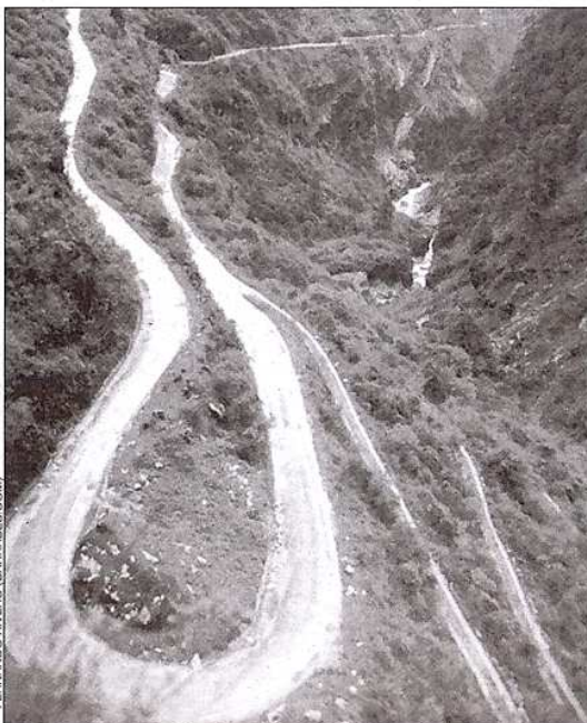
Por este camino discurre la marcha de aproximación a la montaña.

Con este ocho mil el GREIM continúa un camino iniciado en 1999 en los Andes peruanos. Allí, en la Cordillera Blanca, llegaron a las cimas del Huascarán Sur, el Artesonraju, el Almapayo, el Churup y el Pizco.