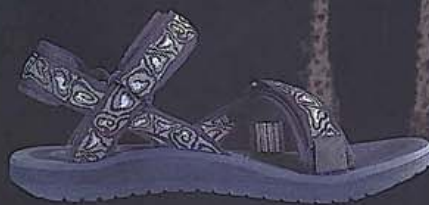
The STREAM SPORT by SOURCE