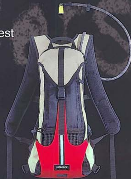
The PACKER by SOURCE