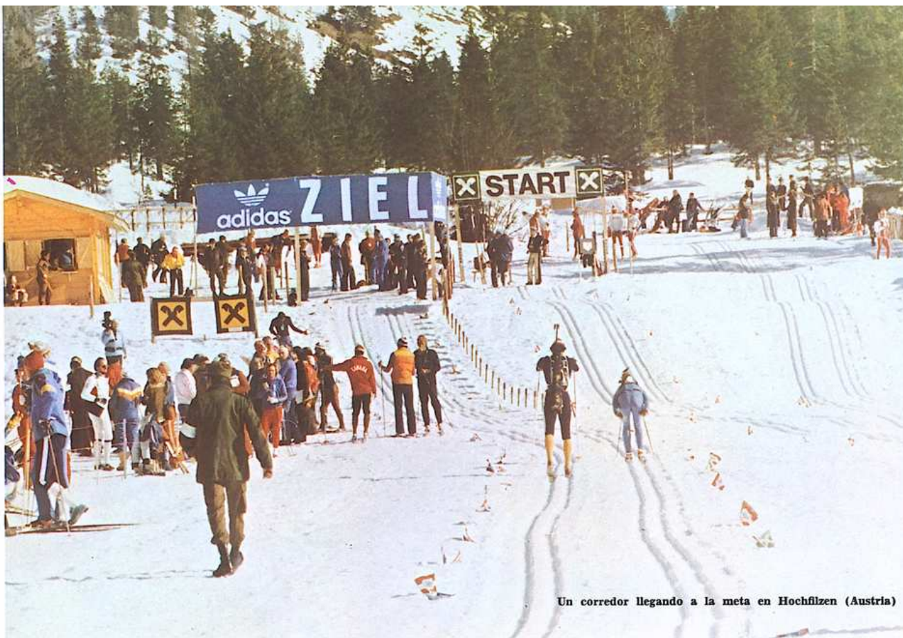
Un corredor llegando a la meta en Hochfilzen (Austria)