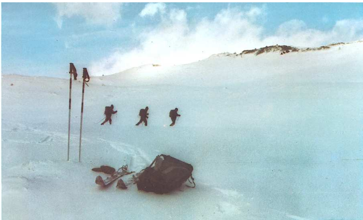
Los guardias componentes del Grupo de Travesía, en una competición por patrullas con el Ejército francés en la Nación vecina

Miércoles.—Mañana: Fartlek (90' y unos 25 km.).