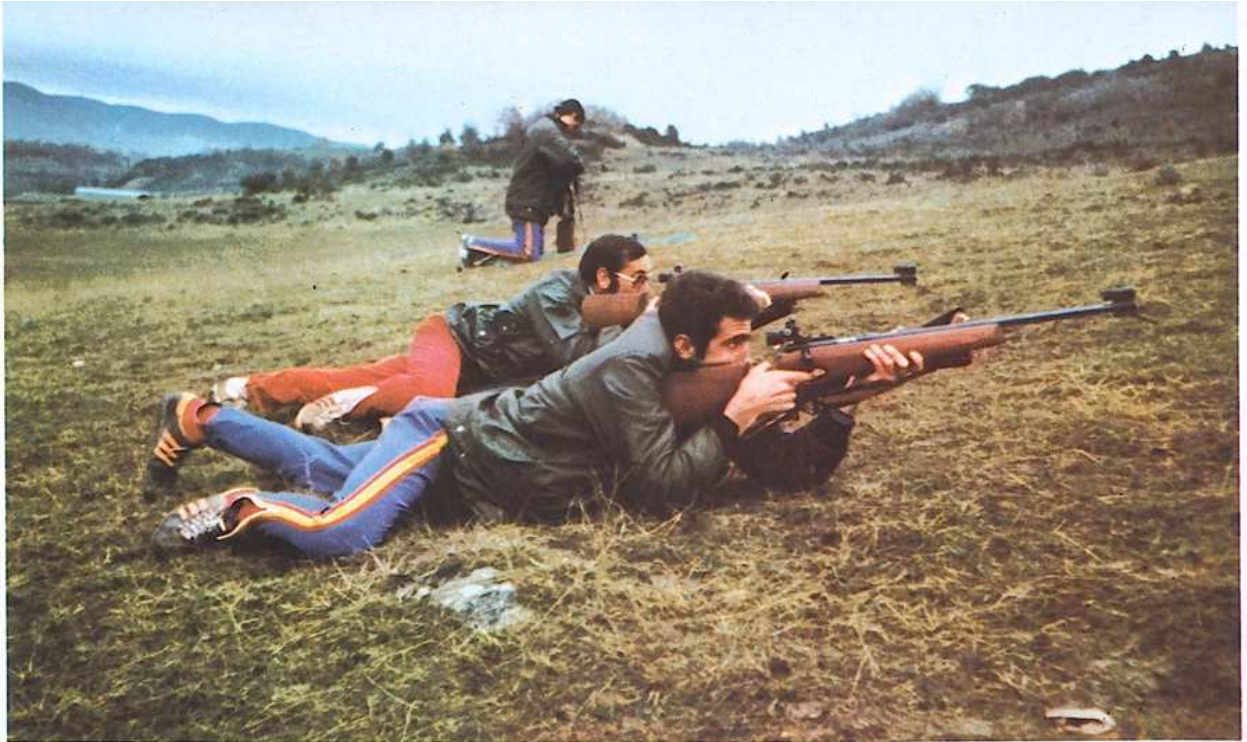
Un momento de entrenamiento diario del tiro, durante la etapa pasada en Jaca (Huesca)

En la escuela de Premanon, entre Francia y Suiza, entrenó parte de la patrulla. En la foto un descenso de dos guardias en la región del Jura